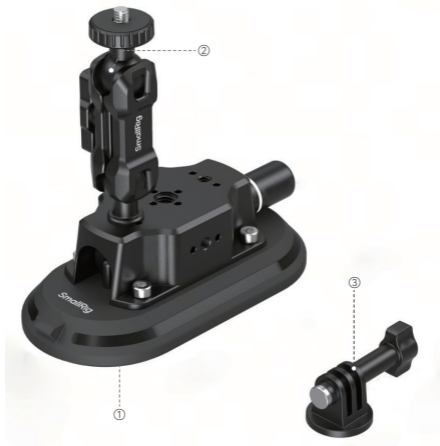
① 4.5" Suction Cup Mount 4.5英寸拓展吸盘